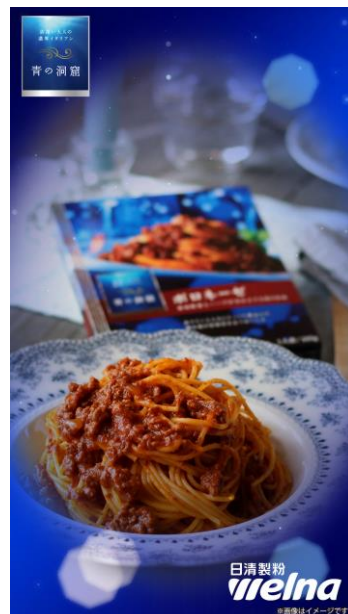
青の洞窟 オリジナルフィルター