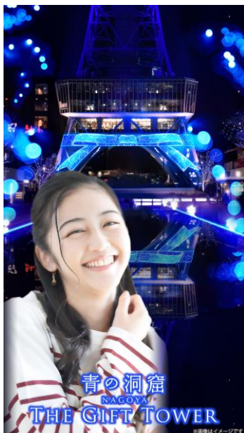
青の洞窟 NAGOYA THE GIFT TOWER フィルター