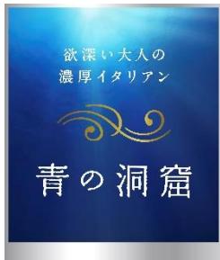
▼日清製粉ウェルナ「青の洞窟」ブランド製品

イルミネーションイベント開催期間中に、中部電力 MIRAI TOWER 展望台のチケットを購入し来場いただいた方などに、限定で日清製粉ウェルナの「青の洞窟」ブランド製品を約5,000名様にプレゼントします。