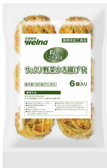
サククリ野菜かき揚げ R