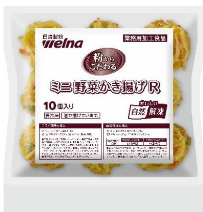
ミニ野菜かき揚げ R

当シリーズのかき揚げは、野菜の甘みを生かした満足感のある味わいです。当社独自の配合技術により、衣のサククリとした食感が持続し、油っぽくならず、ベタつきを抑えることが可能となっています。いずれも複雑な作業が難しい調理場、ロスを避けたい店舗におすすめです。